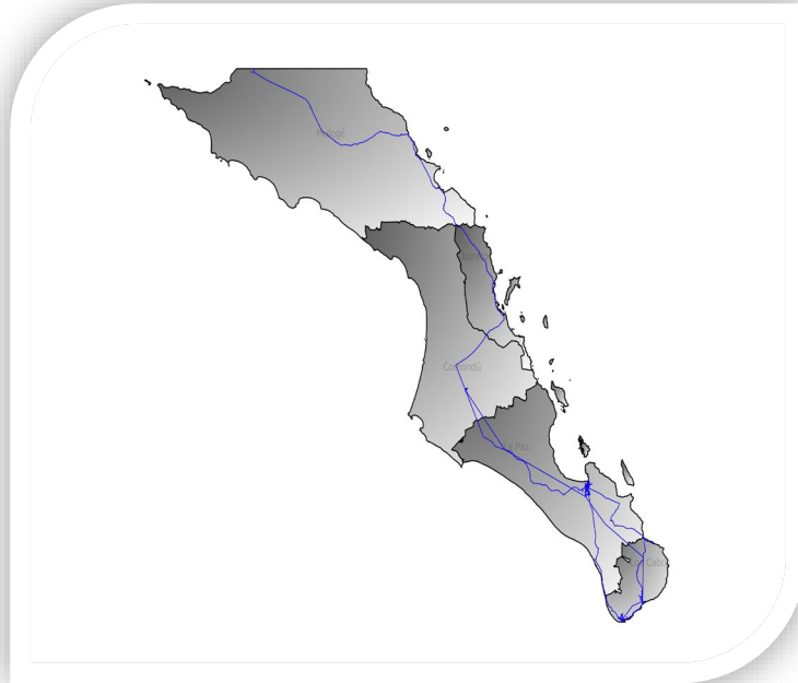
Mapa de red de transporte que se compone de los segmentos de agregación y distribución de fibra óptica a nivel municipal.