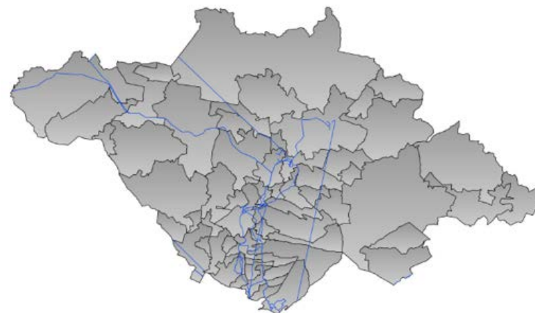
Mapa de red de transporte que se compone de los segmentos de agregación y distribución de fibra óptica a nivel municipal.