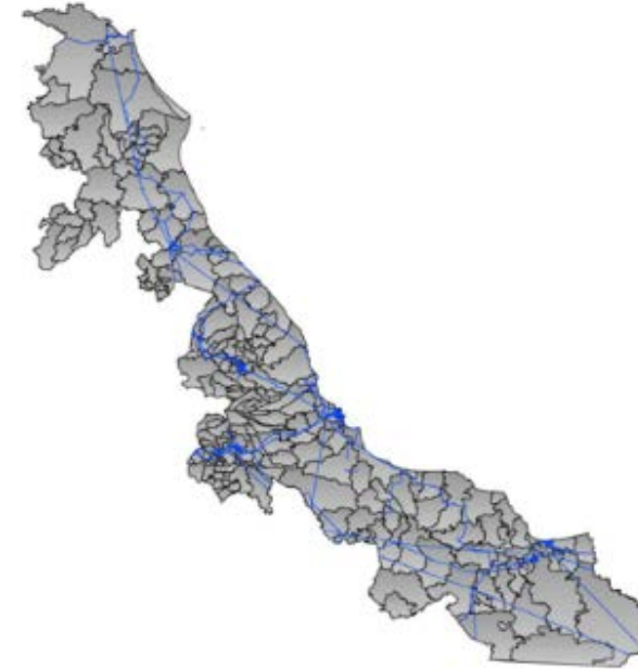
Mapa de red de transporte que se compone de los segmentos de agregación y distribución de fibra óptica a nivel municipal.